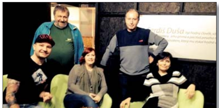
Kunčická skupina Galerie je v našem regionu stále velmi populární. O jejím letošním úspěchu píšeme na straně 3.

Na této akci se nebude vybírat startovné, ale příspěvek na konto Novoročního čtyřlístku ve výši 20 Kč na osobu, který účastníci dají do zvláštní pokladničky. Věříme, že vám všem není lhostejný život postižených, kteří žijí mezi námi. Těšíme se na vaši účast. Délka vycházky bude asi 7 km. Zahájení u Obecního úřadu v Kunčicích pod Ondřejníkem ve 14 hodin a ukončení rovněž u Obecního úřadu asi v 17 hod. Výbor KČT Kunčice pod Ondřejníkem