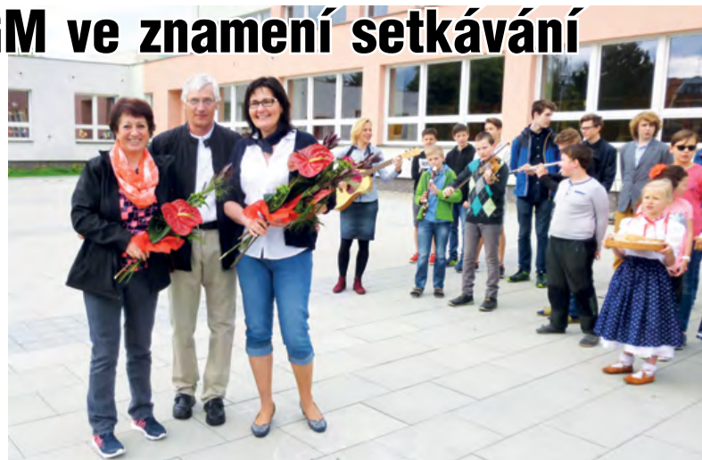
Česko-slovenská ředitelská trojka, uvítání návštěvy v Turzovce 12. 5. 2017.

Zastavme se nejprve u pátku 12. května 2017, kdy byla celá Těgeemka již od rána na nohou. Čekali jsme zde totiž vzácné hosty. Po osmé hodině přijíždí autobus se slovenskými přáteli. Následuje uvítání před školou, první společné posezení, prohlídka školy. Dopolední program pokračuje v Dolní oblasti Vítkovic, kde si žáci užívají Science show, dospělí zas návštěvu unikátní skleněné věže Bolt Tower i s pověstnou kavárnou. Oběd je připraven naší školní restaurací Scolarest. Čas se přehoupne do odpoledních hodin, kdy čeká slovenské přátele nejprve vědomostní soutěž Česko-Slovensko, připravená ve spolupráci žáků devátých ročníků z obou škol, poté následuje komentovaná prohlídka města. Společný zpěv písní v klášterní kapli je pak vyvrcholením celého dne. Kolem osmnácté hodiny se autobus vydává nazpět ke slovenským hranicím. Setkání znovu potvrdilo, že to, co mezi školami funguje, není jen přeshraniční spolupráce. Je to srdečný vztah založený na opravdovém