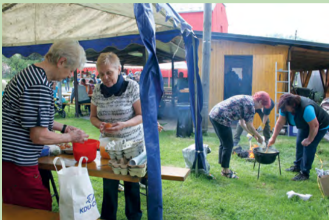
Na setkání tří generací, které se konalo v sobotu 27. května, se potkali lidé všech generací. Voněla vaječnina, malé děti řádily na nafukovacím hradu a větší zkoušeli hasičskou techniku. Nakonec padla i ta májka.