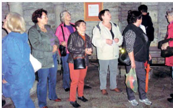
V rotundě na Zámeckém kopci v Cieszyně.

Závěrem přijmete pozvání na další klubové akce. Petr Bernady