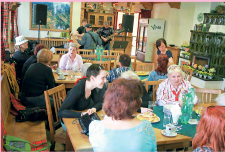
Svátek matek oslavily malenovické ženy v sobotu 13. května v Obecním domě. Na akci, kterou pro ně připravila Obec, vystoupila hudební folk country kapela Čeladenka. Nechybělo občerstvení a dobrá nálada.