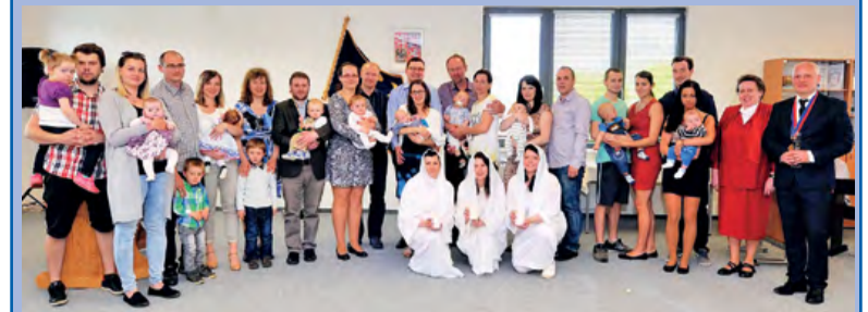
V Pržně máme další várku nových občánků. V neděli 14. května se v sále Občanského centra konalo jejich slavnostní přivítání. Celkem šlo o devět dětí.