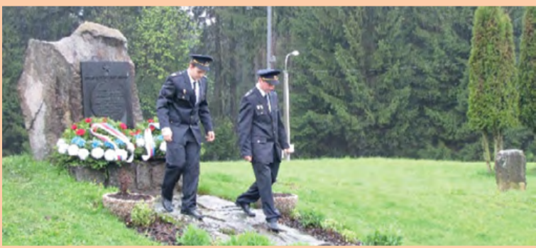
Z vystoupení Cimbálové muziky Polajka...