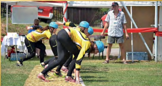
Občerstvení zajištěno. Přijďte podpořit naše závodníky. Srdečně zvou hasiči z Metylovic.

Soutěž se koná v sobotu 1. července 2017 od 13 hodin na fotbalovém hřišti v Metylovicích.