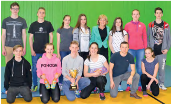
Pohár starostky Města Frýdlantu n. O. 2017

V pátek 5. května se konalo v Opavě krajské finále základních škol a víceletých gymnázií ve volejbalu. Tým mladých volejbalistů ze ZŠ TGM Frýdlant n. O. vyhrál okresní kolo a reprezentoval Frýdecko-Místecko na tomto turnaji. Vítězové všech okresů svedli ukázkové zápasy a předvedli opravdové volejbalové umění. Náš tým se probíjaval až do semifinále, kde už neměl síly na favorizovaný Nový Jičín. Poté však v boji o třetí místo získal po náročném utkání bronz. Patří mu tedy velká gratulace! mk