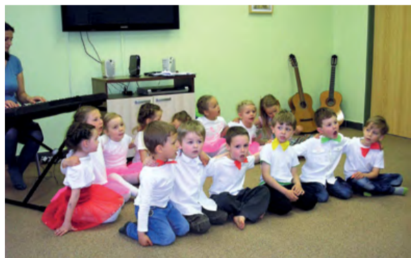
Děti z Berušky zpívají z plna hrdla