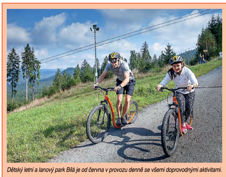
Dětský letní a lanový park Bílá je od června v provozu denně se všemi doprovodnými aktivitami.