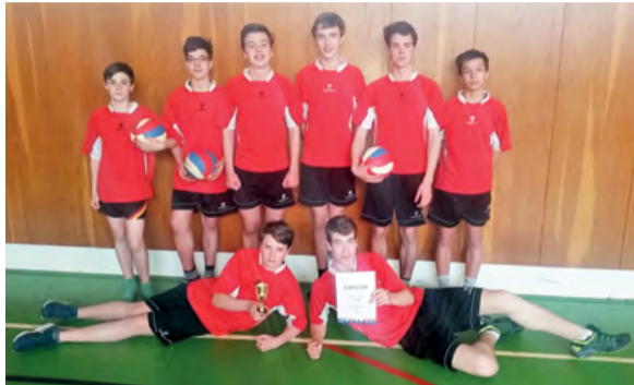
Úspěšní volejbalisté ze ZŠ TGM.