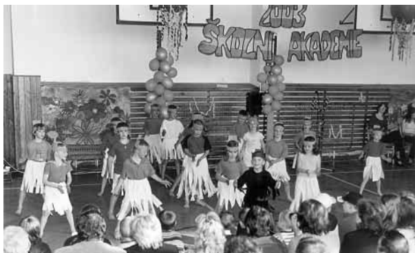
ŠKOLNÍ AKADEMIE 2003 — vystoupení žáků 1. třídy

Dne 16. května 2003 prožívala kunčická škola slavnostní den, na který se všechny děti pilně připravovaly. Sestavovaly a nacvičovaly spolu s třídními učiteli svá vystoupení, kreslily, vystříhovaly, šily a batikovaly, tvořily své kostýmy, aby se zrovna ten jejich kolektiv předvedl v plné parádě. Mladší děti volily pro svá vystoupení radostný tanec a cvičení s hudbou. Starší žáci ukázali ve svých humorných scénkách, co je zajímavé, reagovali např. na známé televizní seriály nebo aktuální události, předvedli také své znalosti z anglického jazyka a žáci deváté třídy si dokonce zavzpomínali na mladší školní léta. Všechna tato vystoupení rovněž doprovázela hudba a veselý pohyb. Snažení účinkujících bylo odměněno vřelým potleskem, který naznačoval, že se jim podařilo pro všechny přítomné vytvořit příjemné odpoledne a kromě malého dárku od dětí v podobě pestrého motýla si návštěvníci snad odnášeli domů i dobrou náladu.