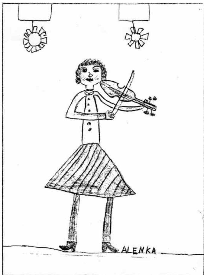
Nakreslila A. Telváková.

Sešli jsme se v sobotu 25. března u MŠ již v 6 hodin ráno, odkud nás autobus vezl na dalekou cestu. Dětem s batůžky plnými smažených řízků, sladkostí a dobrot, za veselého zpěvu, cesta rychle ubíhala. Organizátorky nás velmi srdečně přivítaly a po podíové zkoušce se děti naobědvaly v místní