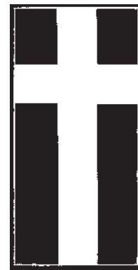
Odznak „Křížového spolku“ — zlatý kříž na modrém pozadí

Vydáno jako příloha Obecních novin duben 2000