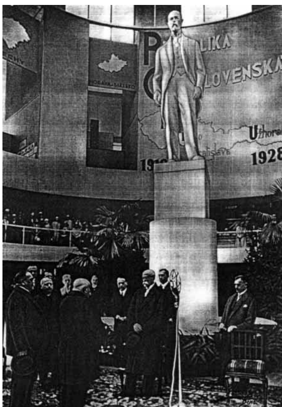
Výstava soudobé kultury v Brně 1928

Podle almanachu výstavy můžeme usuzovat, a zprávy o výstavě v tehdejšímu tisku to potvrzují, že se v Brně odehrávala velkolepá přehlídka průmyslové vyspělosti, velmi dobrého odborného a vysokého školství, obchodu a živnostenství i kvetoucího umění mladého státu.