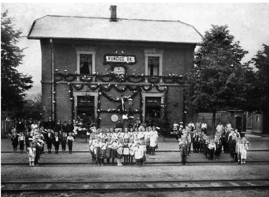
Kunčické děti očekávají průjezd pana prezidenta 25. června 1924.

Dosud mezi námi žijí občané, kteří na tu slávu vzpomínají. Shro- mažďovali se v malých skupinkách podél tratě počínaje úsekem nad