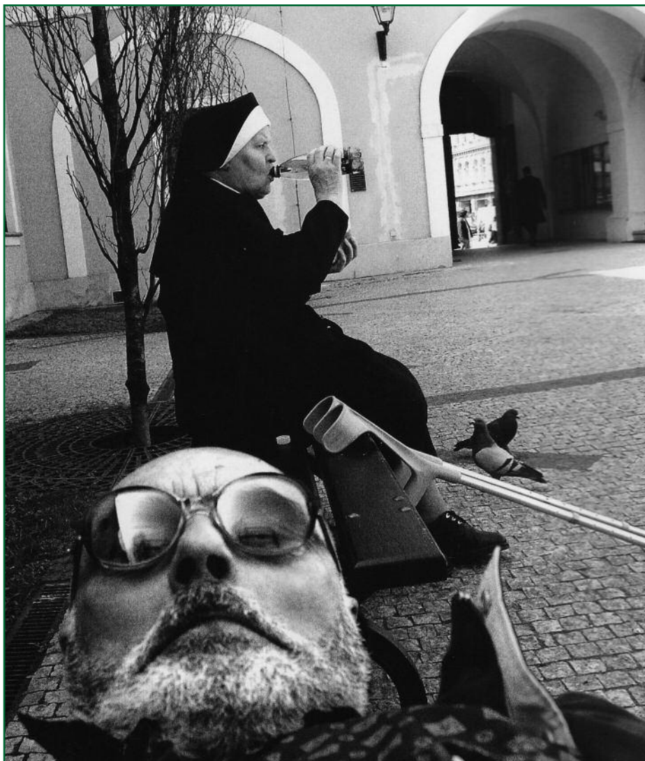
1. místo 2008: „Žízeň“