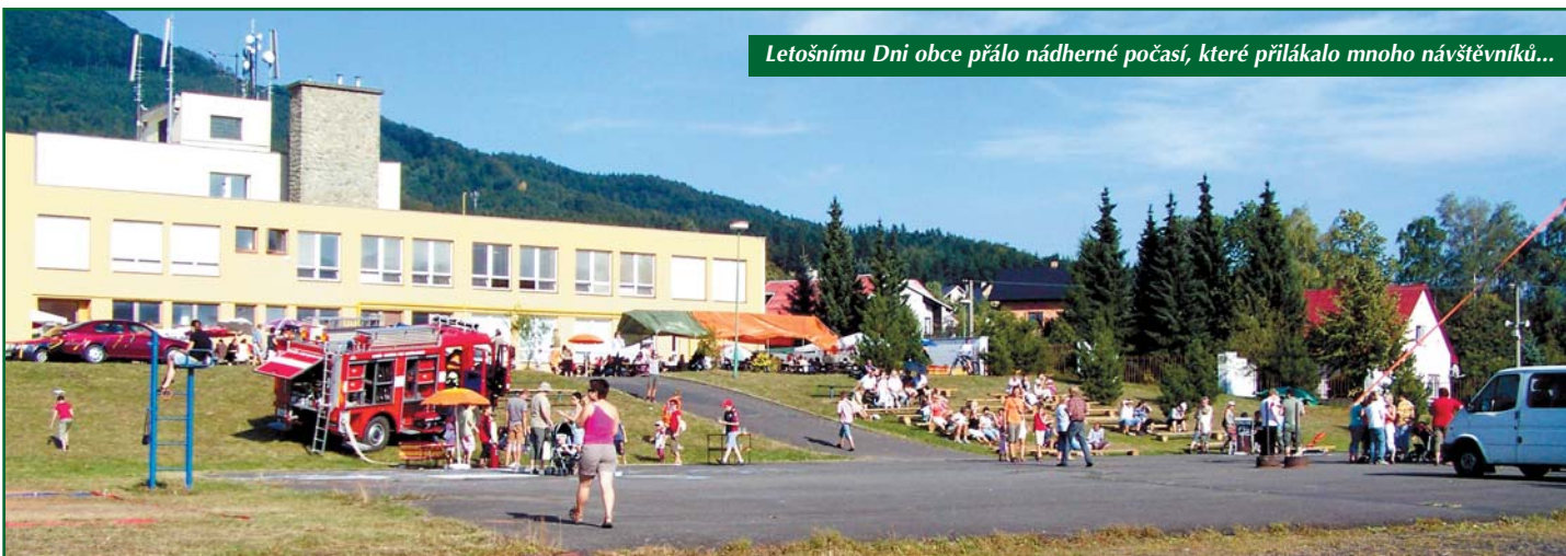
Letošnímu Dni obce přálo nádherné počasí, které přilákalo mnoho návštěvníků...

Děkuji také sponzorům, kteří se podíleli na finančním pokrytí nákladů, které činily přibližně 80 tisíc korun.