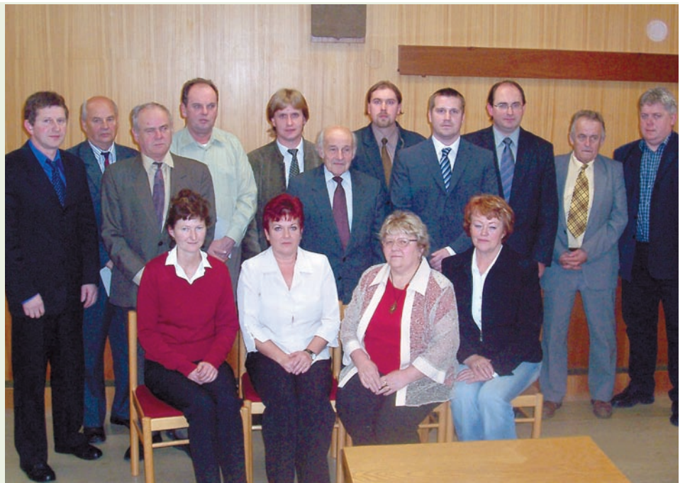
Obecní zastupitelstvo na úvodním zasedání ze dne 7. listopadu 2006.

Byl fyzicky zdatný, sebevědomý a inteligentní. Král jej však chtěl na vůdcovskou roli připravit i po duševní stránce. Věděl, že vůdce musí čelit mnoha výzvám, navíc takovým, které běžného člověka mohou zaslepit a omámit. Aby se jeho syn stal skutečně velkým vůdcem, musel pochopit, co je dívat se na svět z následující perspektivy: Ne všechny dobré věci jsou tak dobré, jak vypadají. A ne všechny špatné věci jsou tak špatné, jak se mohou na první pohled zdát. Pochopení této pravdy mělo být princovi nejcennějším ponaučením v jeho snaze dosáhnout vlastního sebeuvědomění a zasloužit si pověst moudrého vůdce svého lidu.