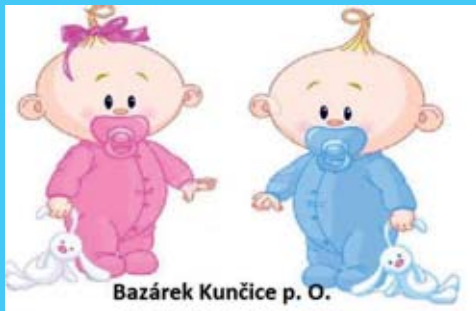
Bazárek Kunčice p. O.