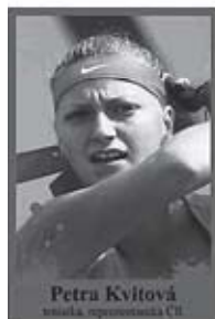
Petra Kvitová tenistka, reprezentantka ČR