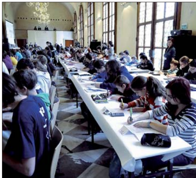
Pohled na účastníky celostátního kola....

Logická olympiáda je soutěž pro žáky základních škol a studenty středních škol založená na logických úlohách, jejichž řešení vyžaduje samostatný a kreativní přístup. Nerozhodují zde naučené znalosti, ale schopnost samostatného uvažování a pohotového rozhodování. Logická olympiáda je svým pojetím unikátní soutěží, protože se nejedná o znalostní soutěž, ale o soutěž rozvíjející především schopnost samostatného logického uvažování.