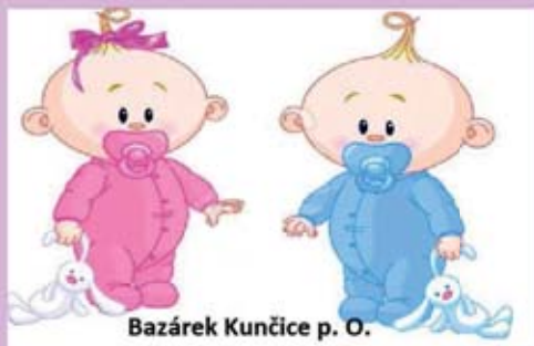
Bazárek Kunčice p. O.