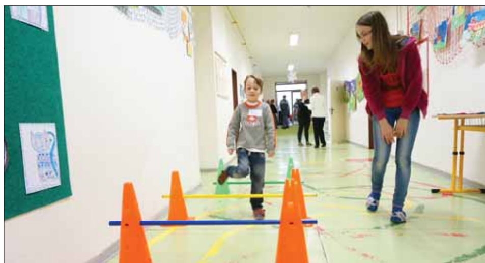
Ještě jednu foto k zápisu prvňáčků....