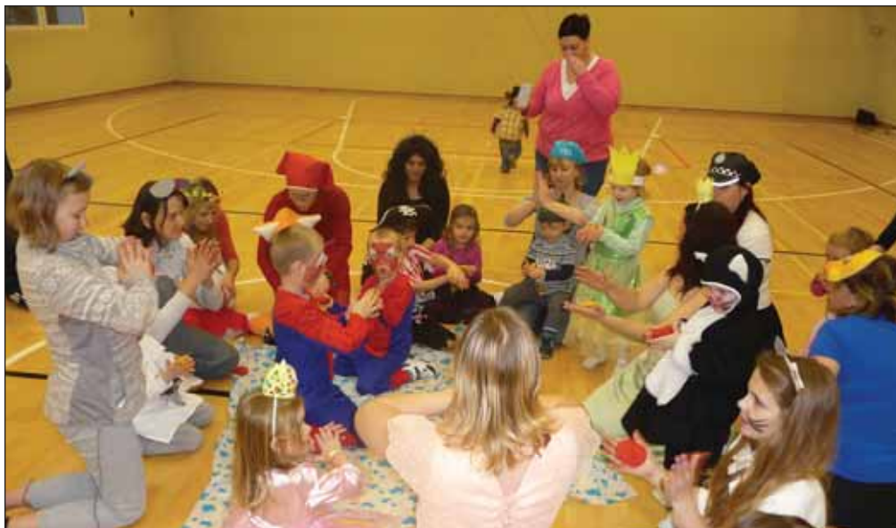
Prvním karnevalem v naší obci byl karneval pro rodiče a děti, kteří chodivají cvičit ve středu do sokolovny.