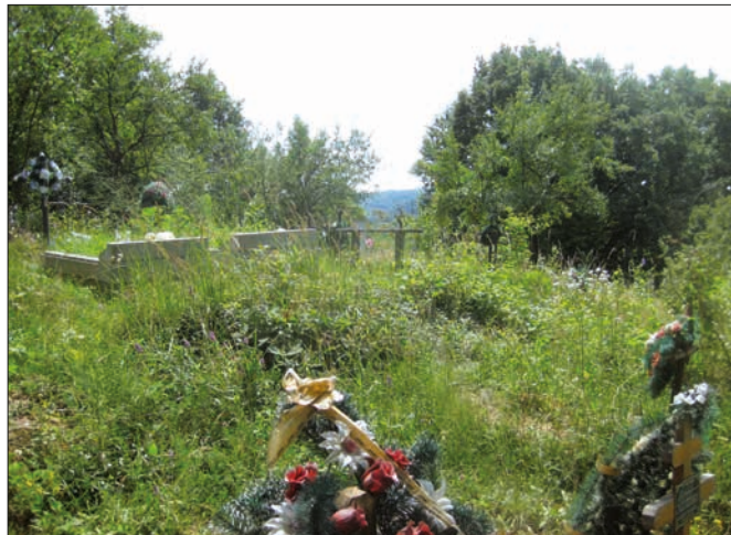
2. Pahorek po bývalém dřevěném kostelíku, kde se nachází v současnosti několik hrobů, z nichž dva světlé náhrobky jsou dobře patrné