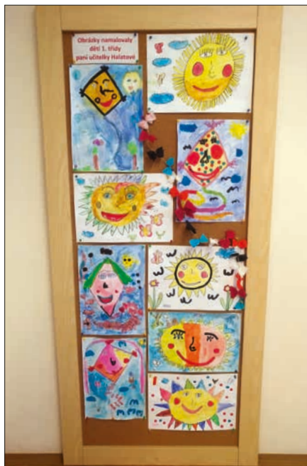
O podzimní výzdobu OÚ se postarali naši noví prvňáčci a Natálka Kociánová.