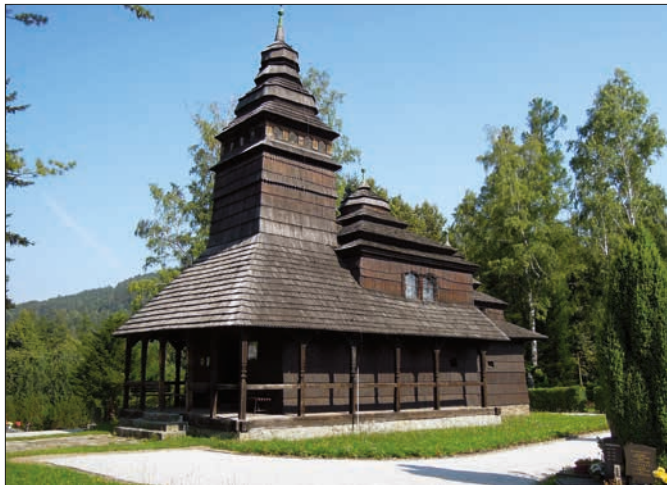
1. Současný snímek kostelíku svědčí nejen o tom, že i u nás byl citlivě zakomponován do krajiny, ale že byl i řádně opraven a je pravidelně udržován