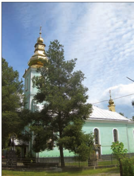
5. Nový zděný kostel ve vesnici