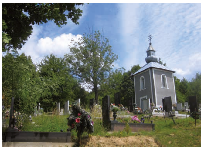
4. Hřbitovní kaple (zvonička) na svahu návrší