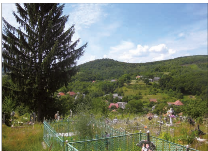
3. Výhled od pahorku do údolí a protějších straní