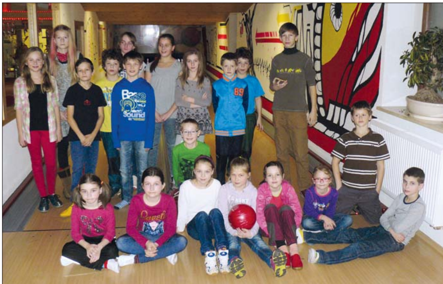
Téměř všichni koledníci společně na bowlingu za odměnu.